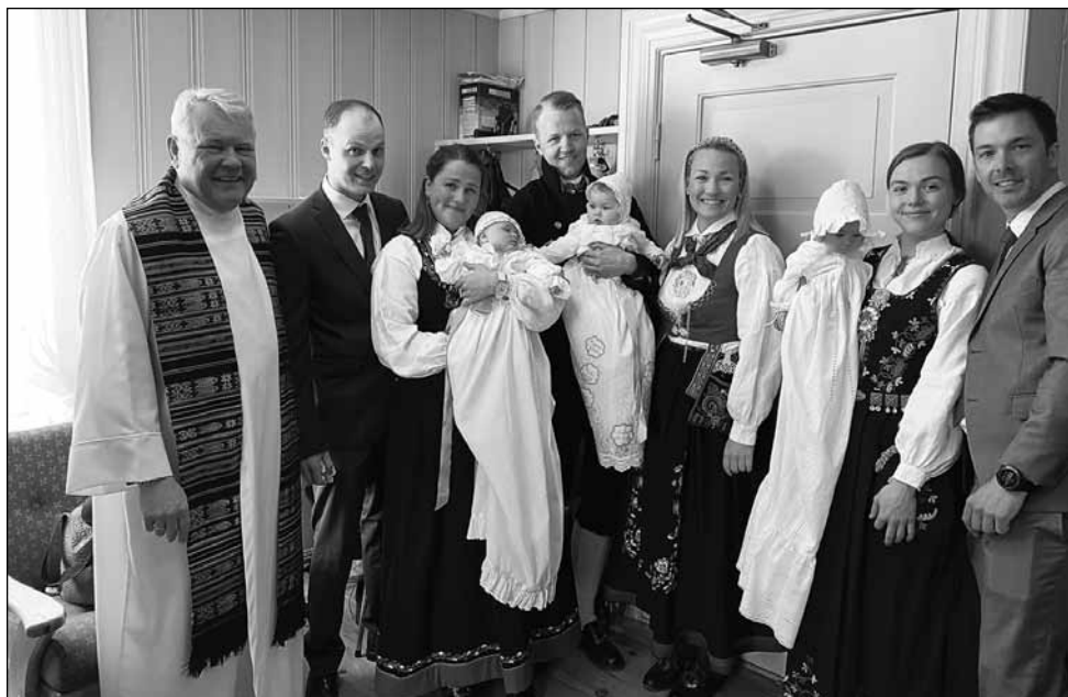
Barnedåp i Alvdal kirke påskedagen.