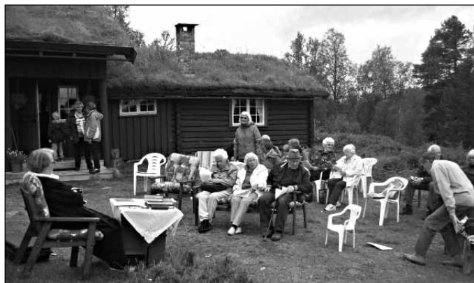
Før setermessen i Lomsjødalen starter.