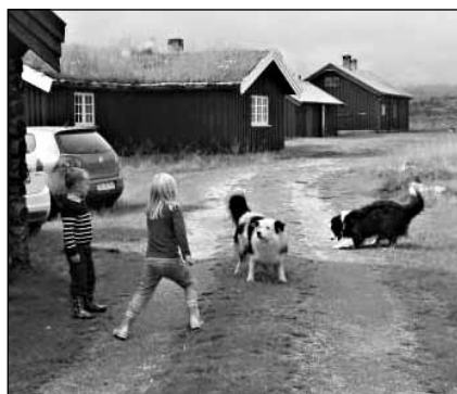
Fra Follandsvengen 2014 i forkant av Tonika 2010.