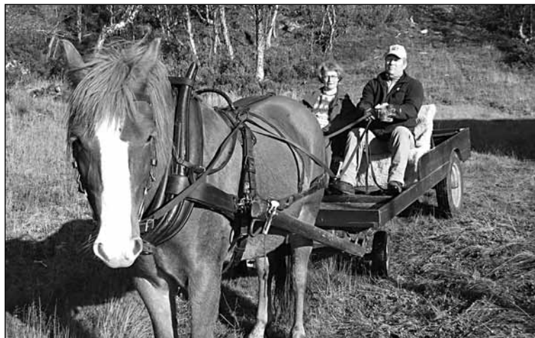
Tradisjonell presteskysse på tur fra Allmannsstua.