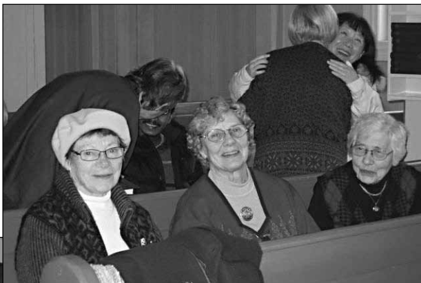
Kirkekaffe i 2012.