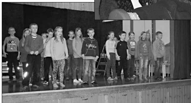
Flinke elever ved Plassen skole under visitasen i 2015.