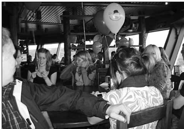
Konfirmanter i Tyholttårnet i 2008.