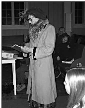
Kjent dame på besøk under Lys Våken i 2015.