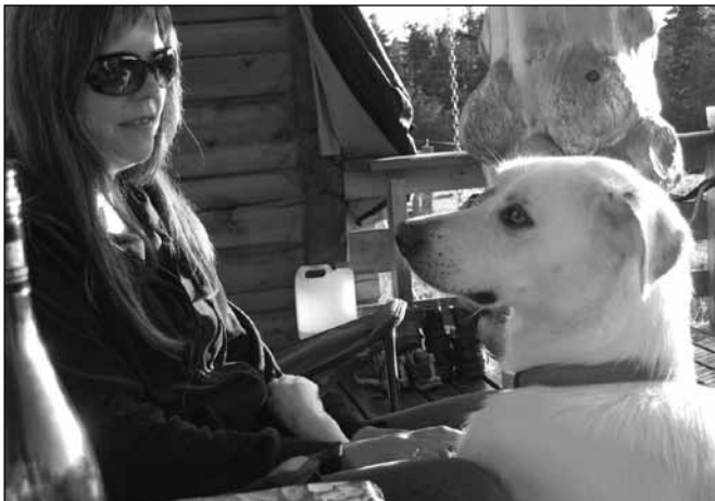
Kantor med hund etter arbeidstid.